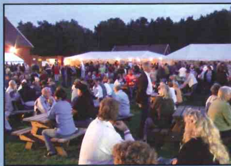
Publikum koser seg en herlig sommerkveld med god musikk.

Slik finner du oss på Tromøy: Kjør den ytre veien mellom Arendal og Eydehavn og ta av over broen til Tromøy. Følg skilting til Hove Leir.