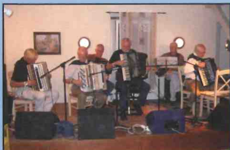
Kongsberg trekkspillklubb spiller til dans i Hovestua.

Idyllisk campingplass med grønne gressletter på stevneområdet, et steinkast fra sjøen og med topp sanitæranlegg!